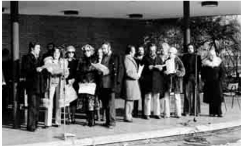
La folta compagnia di attori RTSI, nel 1975, all'esterno dell'edificio di Lugano-Besso.

Il problema degli interpreti ha urtato contro difficoltà non lievi fin dalle prime trasmissioni della Radio Svizzera italiana. Gli attori locali - che non possono essere considerati che dei dilettanti, per ora, sottoposti ad una intensa ed assidua opera di educazione da parte nostra, hanno senza dubbio fatto immensi progressi, sia nella lettura, che nella chiarezza e nella esattezza della dizione. Non per questo, tuttavia, si può affermare che il problema di creare degli attori ticinesi nel senso completo della parola sia di facile soluzione; e ciò per parecchie ragioni ambientali, fra le quali accenneremo alla mancanza di tradizioni